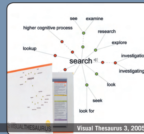
Visual Thesaurus 3, 2005